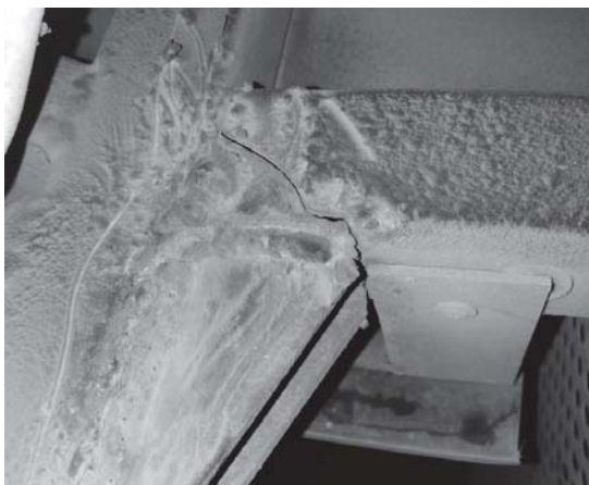
Рис. 9. Тріщина труби каркасу основи кузова в передній частині

Пошкодження правої частини пояснюється більшим навантаженням на праву сторону автобуса, рухом по обочині, ударами об бордюри тощо.