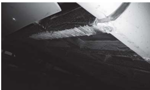
Рис. 3. Пошкодження поперечини в задній частині кузова

На додачу до перевантажень суттєвий вплив мають і дороги низької якості: неякісно прокладена бруківка, вибоїни, горби тощо. В результаті такої експлуатації можуть виникати пошкодження в задній частині кузова (рис. 3).