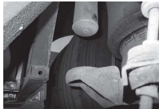
Рис. 5. Обірваний шток амортизатора задньої підвіски

При постійному перевантаженні в години пік та пасажирооборотом не менше 1000 пасажирів у день, що є характерним для міст з кількістю населення понад 1 млн. жителів (наприклад у м. Київ), неминуха поява тріщин каркасу основи у задній частині кузова (рис. 7).