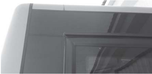
Рис. 1. Тріщина даху над задніми пасажирськими дверима

них розрахунках з використанням МКЕ закладається коефіцієнт перевантаження 1,5–1,7, чого вже не достатньо для реалій експлуатації при перегонах перевізників за прибутком.