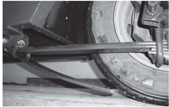
Рис. 4. Обламування задніх ресор

При такій експлуатації виходять з ладу елементи задньої підвіски: ламаються ресори (рис. 4), обриваються штоки амортизаторів (рис. 5) та обламуються упори пневморесор (рис. 6).