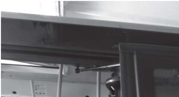
Рис. 2. Тріщина даху над передніми пасажирськими дверима

На додачу до перевантажень суттєвий вплив мають і дороги низької якості: неякісно прокладена бруківка, вибоїни, горби тощо. В результаті такої експлуатації можуть виникати пошкодження в задній частині кузова (рис. 3).