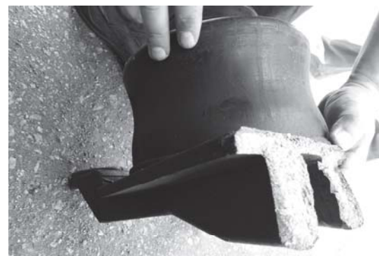
Рис. 6. Обламаний упор пневморесори задньої підвіски

Також виникають проблеми і з передньою частиною каркасу кузова. В результаті експлуатації при пробігу близько 60 тис. км утворюються тріщини каркасу основи. Пошкоджуються основні повздовжні лонжерони перерізом 140x60x3 мм (це стосується у пе-