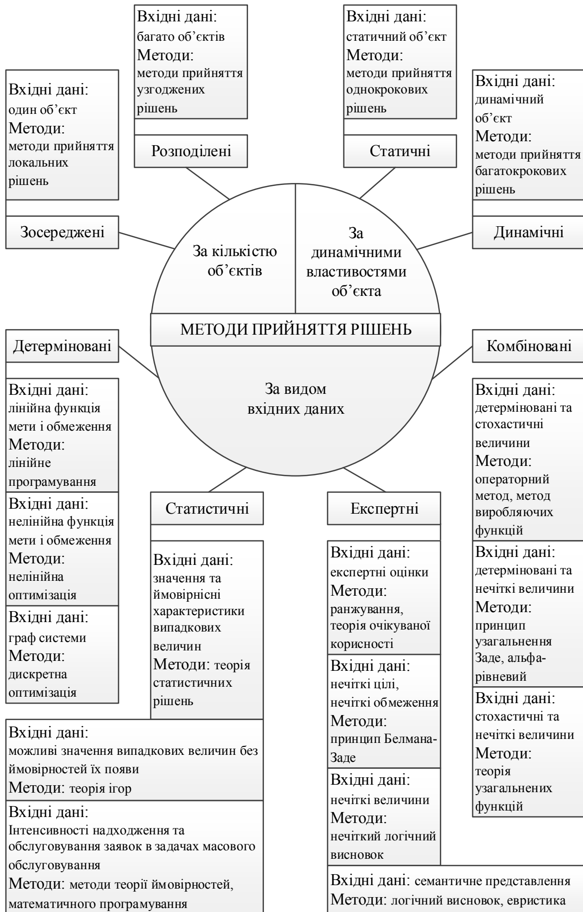
Рис. 1. Класифікація методів прийняття рішень в умовах невизначеності