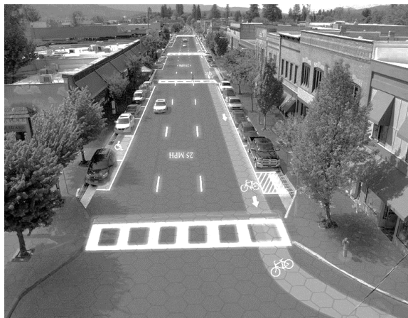
Рис. 2. Система, що складається з багатофункціональних панелей дорожнього покриття на певній частині дороги у населеному пункті

Суть запропонованої ідеї та технічного рішення пояснюється схематичними кресленнями. На рис. 3,а показано схему способу виконання дорожньої розмітки та автоматичного керування рухом автотранспортних засобів. На рис. 3,б показано схему зміни дорожньої розмітки [9, 10].